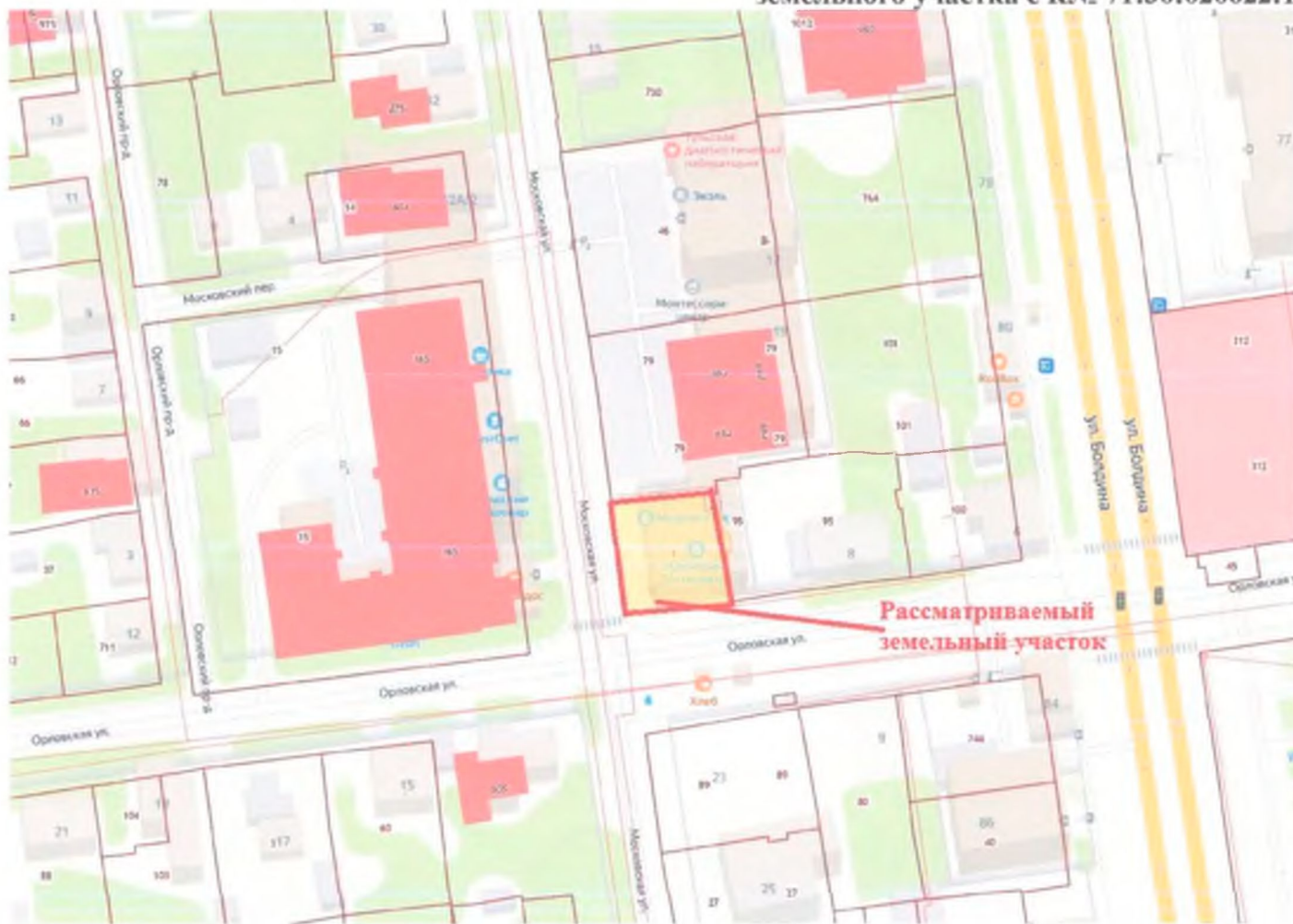
Иллюстрация №1. Расположение рассматриваемого земельного участка с К№ 71:30:020622:1

Градостроительное обоснование подготовлено в отношении земельного участка с кадастровым номером 71:30:020622:1, расположенного по адресу: г. Тула, район Привокзальный, ул. Московская, дом 21. Рассматриваемый земельный участок расположен в пределах застроенной территории на пересечении улицы Орловская и улицы Московская в Привокзальном районе города Тулы.